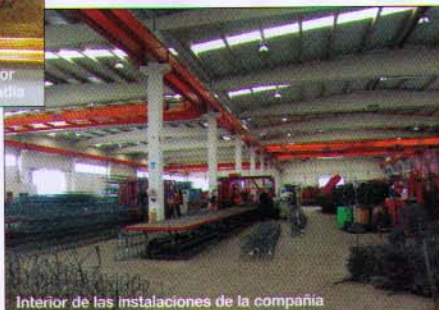
Interior de las instalaciones de la compañía

Asimismo, para garantizar un precio competitivo a sus clientes, la empresa dispone de un importante stock de materia prima que le permite mantener los precios acordados pese al incremento del coste del metal.