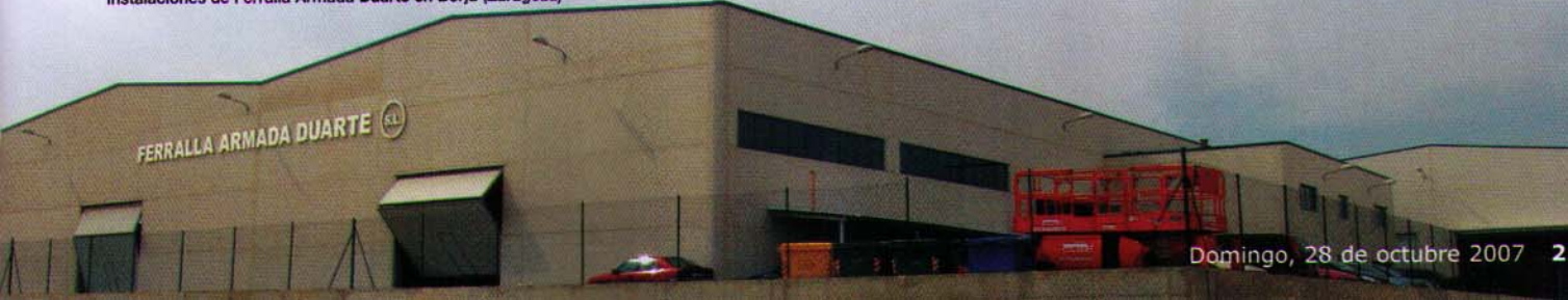
Instalaciones de Ferralla Armada Duarte en Borja (Zaragoza)