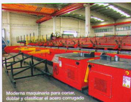
Moderna maquinaria para cortar, doblar y clasificar el acero corrugado

En la actualidad, Ferralla Armada Duarte ha alcanzado una producción de 2.000 toneladas mensuales, una cifra que se incrementa constantemente gracias a la capacidad de crecimiento de que aún dispone la compañía.